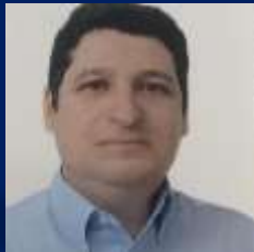
Presidente da mesa: